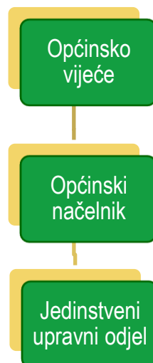
Shema 1. Organizacijska struktura Općine Jelenje